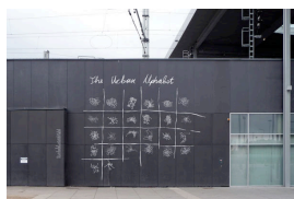
Städtische Kartographien als

Dem Bahnhof als Ort der Kommunikation und Wissensproduktion nähert sich Nikolaus Gansterer mit einer Intervention auf den schwarzen Wandvertäfelungen des Gleiskörpers. In The Urban Alphabet (2009) abstrahiert der Künstler Kartographien internationaler Städte wie Amsterdam, Berlin, Istanbul oder Jerusalem, um aus geographischen wie städteplanerischen Strukturen ein 26-teiliges Alphabet zu entwerfen. Aus sich zufällig gebärdenden Piktogrammen generiert er eine Art Universalsprache, die den globalisierten und somit gemeinhin verständlichen Zeichencharakter des Ortes einmal mehr herausstellen soll.