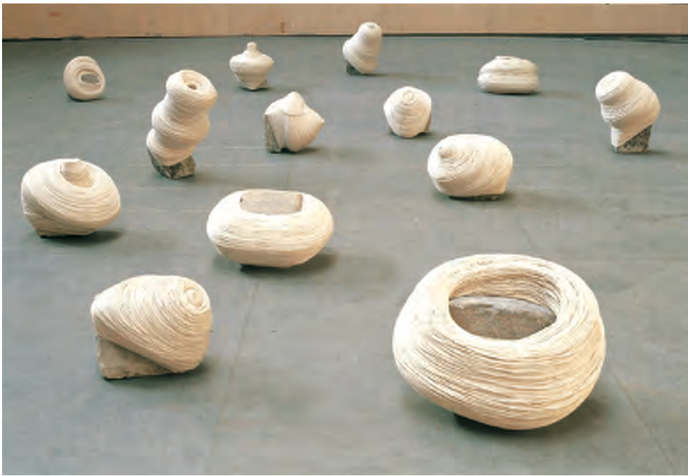
Myung-Ok Han, Pavés, 1993 – 1995

Pierres et fil collé, dimensions variables