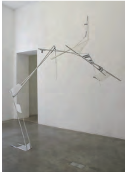
Alice Cattaneo, Untitled , 2008

Les images de Vik Muniz quant à elles illustrent cette forme de simplicité généreuse de façon plus ludique puisque l'artiste a choisi de photographier des formes en pâte à modeler. Ces 52 portraits flous d'apparitions informes et étranges sont autant d'hommages aux petits riens, à une forme de malice d'une création libérée de la figuration, du formalisme et du précieux.