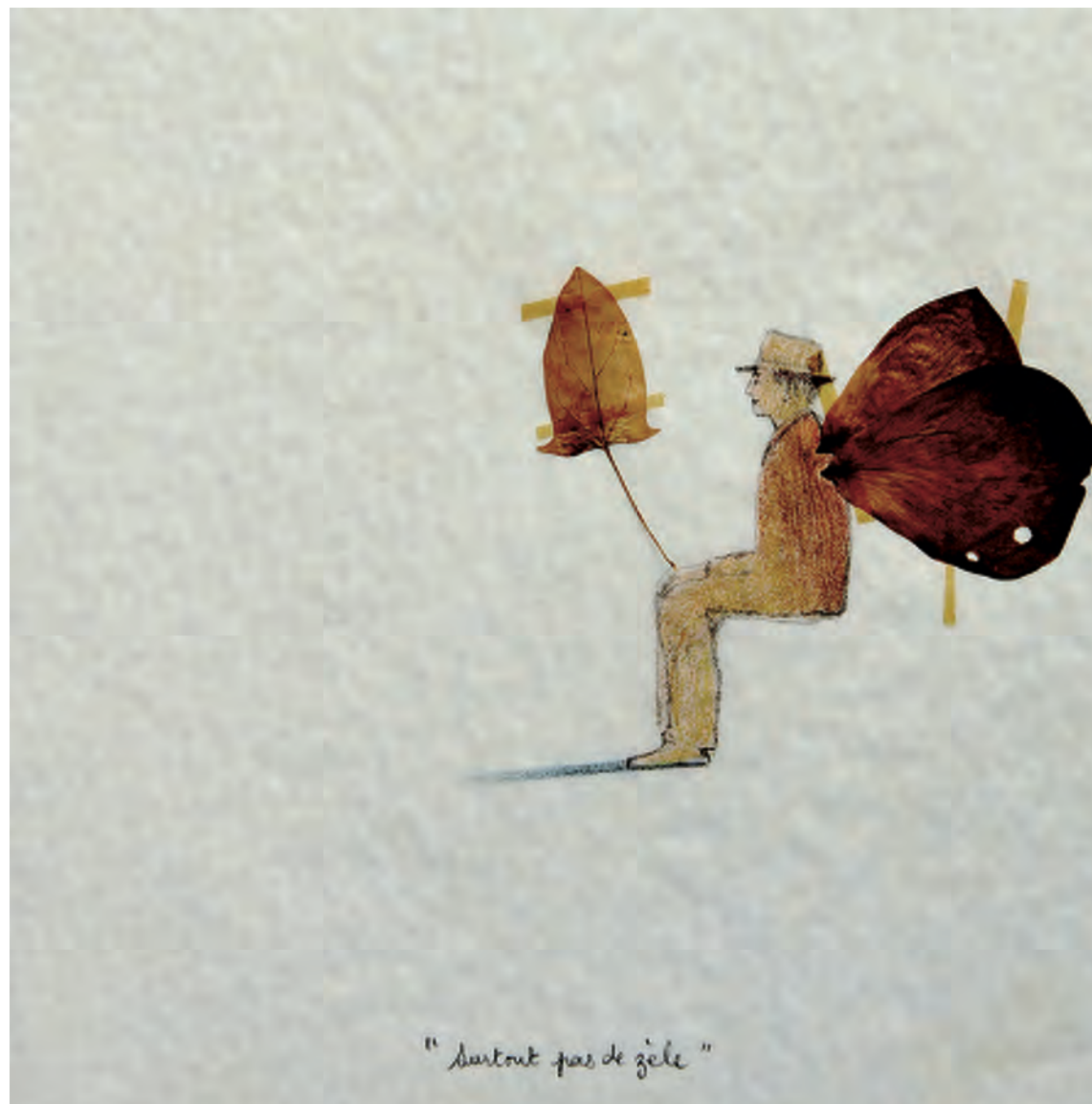
Françoise Pétrovitch, Herbier , 1994 Techniques mixtes sur papier (détail, ensemble de 14 dessins, 21 × 21 cm)

Ouvert tous les jours de 10h à 18h sauf le mardi, le 14 juillet et le 15 août.