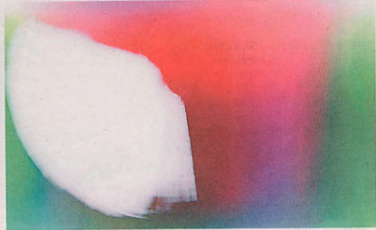
Luz y Color. Una gran área blanca domina parte del cuadro.