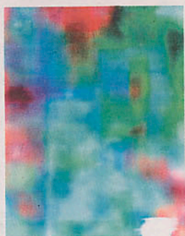
La pieza 'Ino's Ankle'.